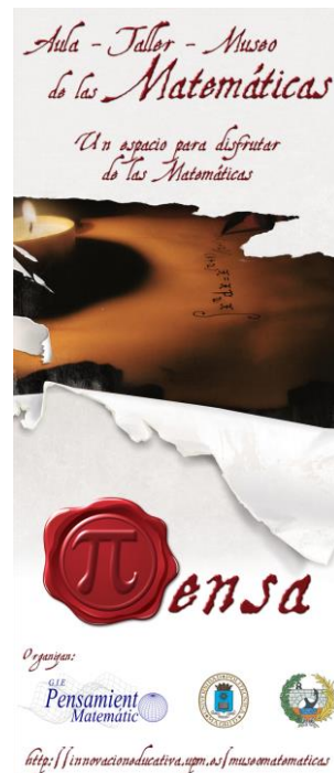
Figura 1. Póster del Aula Taller Museo de las Matemáticas.

La creación de un Aula Taller Museo de las Matemáticas surge con la intención de convertir este espacio en un centro cultural dirigido tanto a la comunidad educativa como al público en general, y en el cual se desarrollen diferentes actividades, por ejemplo: