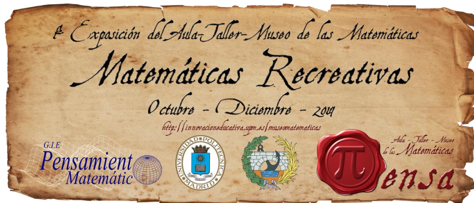
Figura 4. Póster asociado a la primera exposición de π-ensa.