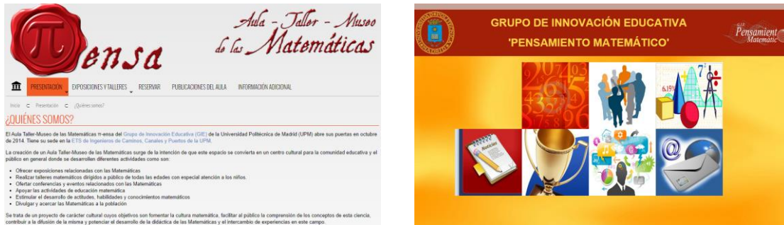
Figura 2. Portadas de las páginas web del museo y del G.I.E.

La información más relevante del GIE se halla en la página: http://www.caminos.upm.es/matematicas/WEBGIE/