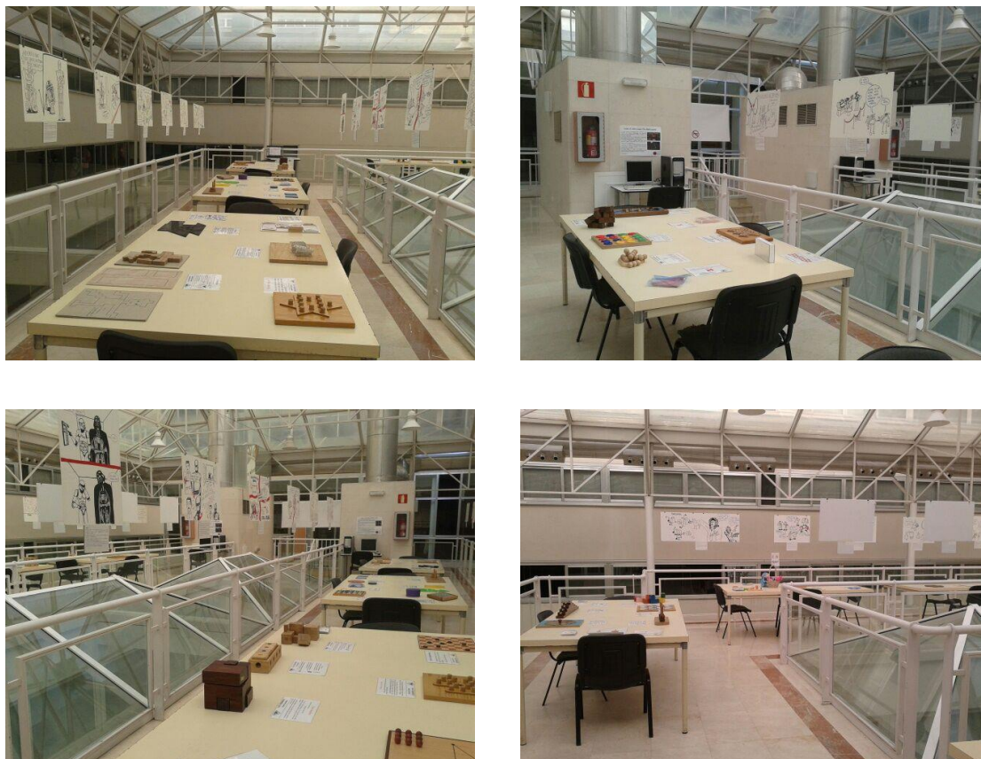
Figura 3. Algunas instantáneas de las instalaciones del Aula Taller Museo.

Para hacerse una idea del Aula Taller-Museo de las Matemáticas lo más recomendable es darse una vuelta por sus instalaciones y adentrarse en la experiencia en vivo.